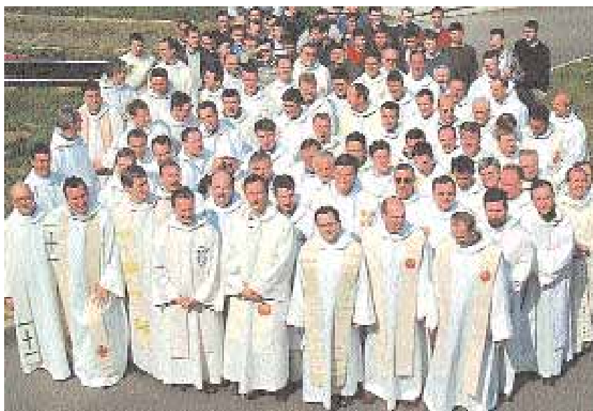
Els sacerdots, feliços de viure la seva missió amb els laics.

lloança, que marca el seu ser i el seu ministeri, és una actitud d'admiració i una mirada d'esperança sobre l'obra de Déu en el món i en l'Església. És un adorador del Pare. Passa llargues estones al davant del Santíssim Sagrament, en la presència de Jesús en l'Eucaristia per demanar un cor semblant al seu: "Jo us donaré pastors segons el meu cor..." La seva vocació, la seva vida i la seva predicació, estan relacionades amb l'espiritualitat del Cor de Jesús. Aquest cor