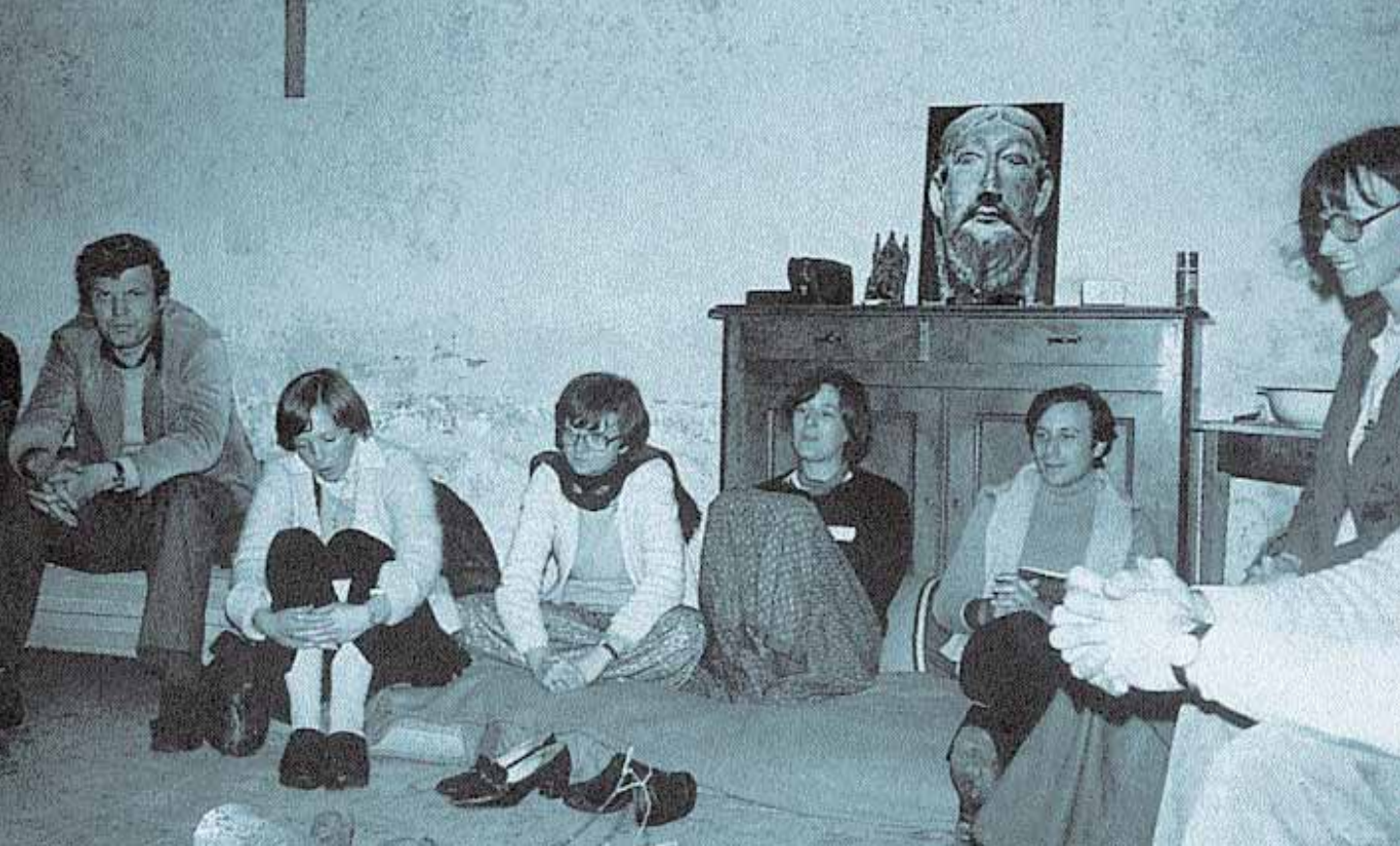
Un dels primers grups de pregària de l'Emmanuel.

persones. Un any més tard, són cinc-cents! Cal doncs traslladar-se en diverses ocasions i fundar dos grups de pregària més a París. En aquestes assemblees de pregària, succeïxen meravelles i les vides de moltes persones és transformada. El nom d' "Emmanuel" és rebut de Déu per descriure aquesta realitat que tot just s'està fundant.